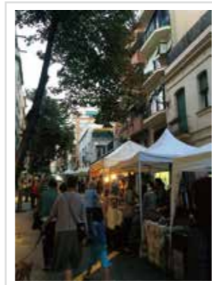
◀ 食べ歩きをしながら、友人やお店の人とおしゃべりを楽しみながら、様々な店舗を見て回っています。

バルセロナは露店が盛ん！街中で見かけますが、ここサリアー地区では、地元のお店によるお菓子やアクセサリなどの販売、さらには普段手に入らないバルセロナ郊外の手作りチーズや腸詰めなどの食材も販売されています。「これはいくら？」「産地はどこ？」ちょっとした会話を楽しみつつ、バルセロナの地元感を味わえる空間。ここでしか買えないバルセロナみやげ探しをしてみてもいい？