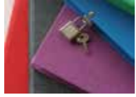
Pepa Paper 鍵付き日記帳 ¥ 3,240 (アンテナ カタルーニャ) 人気 No.1 大人のための日記帳。性別年齢問わず使えるためギフトにも。