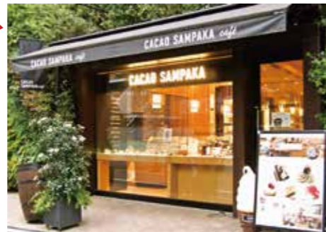
カカオサンパカ南青山 東京都港区南青山5-5-24 TEL.03-5766-0018 http://www.cacaosampaka.jp/