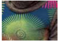
Smash セーター ¥ 8,500 (ドゥエドゥエ) カラフルな幾何学フラワーをプリントしたオフターゲットセーター。柔らかな着心地でデニムにもマッチ。