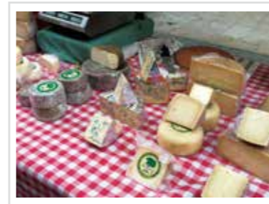
▼ バルセロナのお隣、シロナ県産手作りチーズ。ハーブ風味のヤギチーズを試食→購入。とてもまろやかで美味しかったです！！