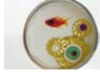
Elisa Brunells シルバーリング ¥32,400 (ミコロール) モチーフ部分の直径が 2.2cm の存在感。ゴールドのお花とワンポイントの金魚で上品に。

バルセロナの人気文具店『PEPA PAPER (ペパ・パペー)』のキレイな色の鍵付き日記帳を小脇に抱えれば完成です☆